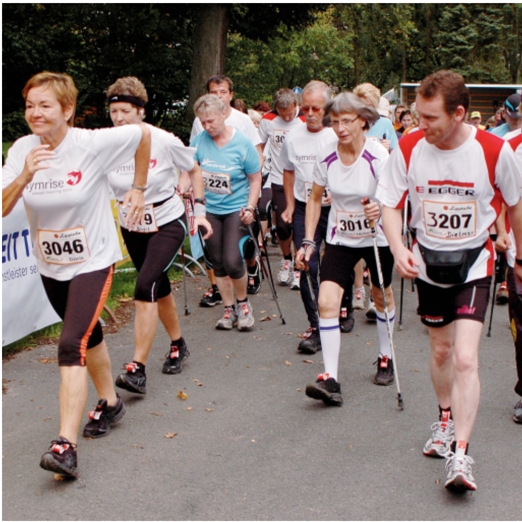
Gute Resonanz: Zwar nahmen mit 850 Läufern weniger Menschen teil als beim Cheruskerwalk 2010, doch sind die Veranstalter mit dem Verlauf zufrieden.

Die Grundschule Horn, auf die John geht, gewann den großen Wanderpokal für die meisten Teilnehmer. 78 hatte sie auf die Strecke geschickt. Mit 55 Startern war die Grundschule Wüsten am zweitbesten vertreten. Drittstärkste Schule war das Gymnasium Horn. Außerdem waren die Grundschule Diestelbruch, Realschu-